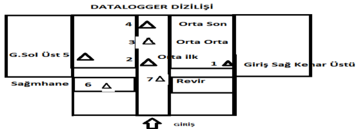
Şekil 2. İşletme Veri Kaydedici Ölçüm Noktaları (PCE-HT 71N Datalogger)